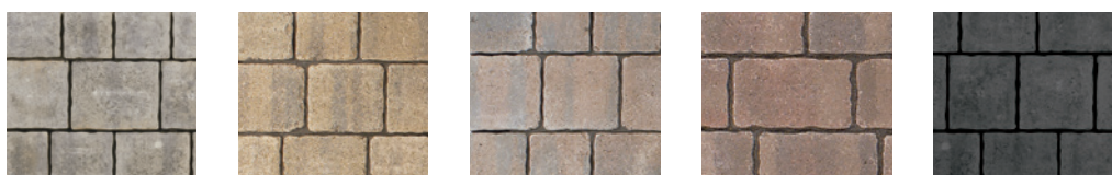
● Gris calcaire ● Beige grès ● Brun terracotta ● Rouge grenat ● Noir