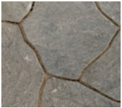
● Gris et charbon