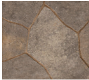
● Beige travertin