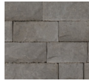
● Gris et charbon