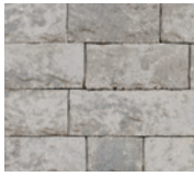
● Gris glacier