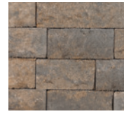
● Chamois cendré