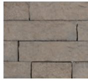
● Gris ollaire