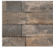
● Beige travertin