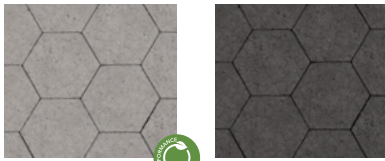
● Gris granite ● Noir